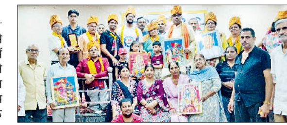
रेवाड़ी। कार्यक्रम में अतिथियों का सम्मान करते आयोजक।