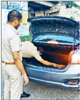
रेवाड़ी। कार की डिग्मी की जांच करते हुए पुलिसकर्मी।

पुलिस ने इस वर्ष क्राइम डिटेक्शन के मामले में भी सराहनीय कार्य किया है, जिसके चलते अपराधिक गतिविधियों पर अंकुश लगाने में सफलता मिली है। जनवरी से अगस्त माह वर्ष 2024 की तुलना में इस वर्ष अगस्त माह तक हत्या के मामलों में 24 फीसदी की कमी, हत्या के प्रयास के मामलों में 21.1 फीसदी की कमी, लूट के मामलों में 63.2 फीसदी की कमी, मारपीट के मामलों में 24.6 फीसदी की कमी, स्नोचिंग के मामलों में 26.1 फीसदी की कमी, संध मारी के मामलों 23.6 फीसदी की कमी, रंगदारी के मामलों में 50 फीसदी की कमी, सड़क दुर्घटना के मामलों में 8.1 फीसदी की कमी के साथ महिला विरुद्ध अपराधों में 43 फीसदी की कमी आई है।