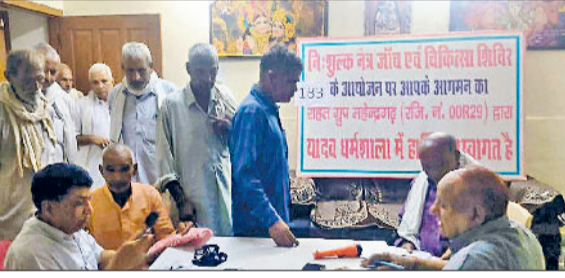
महेन्द्रगढ़। नेत्र उपचार शिविर में भाग लेते नेत्र रोगी।