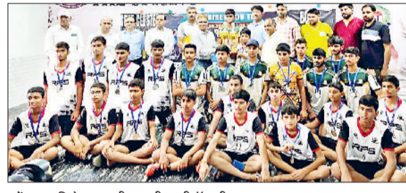
महेन्द्रगढ़। विजेता आरपीएस की वालीबॉल टीम।

आरपीएस विद्यालय ने एकबार फिर अपनी खेल प्रतिभा से जिले का मान बढ़ाया है। हाल ही में आयोजित सीबीएसई क्लस्टर वालीबॉल प्रतियोगिता में विद्यालय की अंडर-14 और अंडर-19 (आयु वर्ग) की टीमों ने सोनीपत में शानदार प्रदर्शन करते हुए सिल्वर मेडल प्राप्त किया। दोनों ही वर्गों की टीमों ने प्रतियोगिता के दौरान उत्कृष्ट तालमेल, संघर्षशीलता और खेल भावना का परिचय दिया। इस उपलब्धि पर