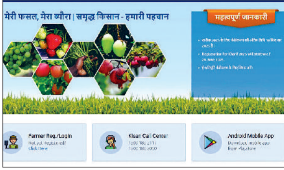
नारनौल। मेरी फसल मेरा ब्यौरा पोर्टल।

प्रदेश में किसानों को मंडी में समर्थन मूल्य पर फसल बेचने के लिए मेरी फसल मेरा ब्यौरा पोर्टल पर पंजीकरण करवाना जरूरी किया गया है। इसके बाद ही सरकार की ओर से किसानों की फसलों को समर्थन मूल्य पर टोकन प्रक्रिया अपनाकर खरीदा जाता है। खरीफ फसलों के पंजीकरण के लिए 20 जून से पोर्टल को खोल दिया गया था। जिसके बाद से लगातार पंजीकरण प्रक्रिया शुरू है। निर्धारित पोर्टल के अनुसार किसान 10 सितंबर तक अपनी फसल का