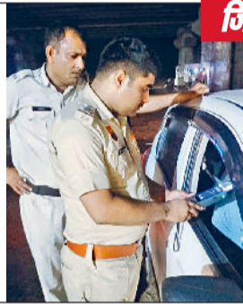
रेवाड़ी। कार चालक की एल्कोहल की मात्रा चेक करती पुलिस।